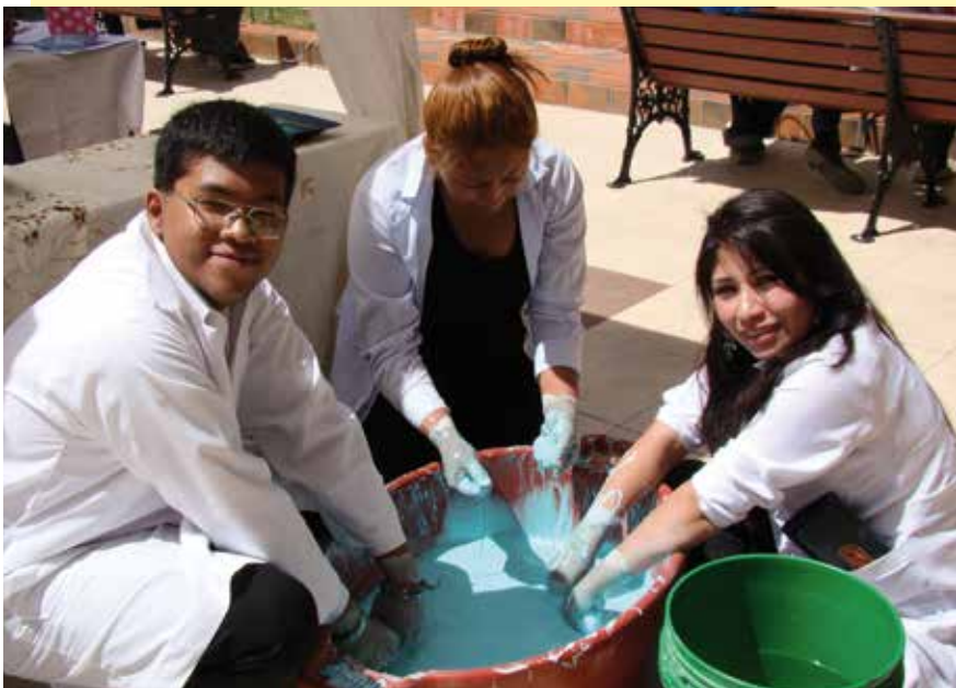
Estudiantes de Ing. Civil

El viernes 28 de noviembre, el patio central de la universidad recibió a más de 120 expositores de todas las carreras que ofrece nuestra institución. Grupos divididos en diferentes áreas como tecnología, ciencias naturales, ciencias básicas, Derecho, Comunicación Social, entre las más populares, presentaron proyectos llenos de creatividad e innovación, tanto en las ideas de negocios como en prototipos tecnológicos.