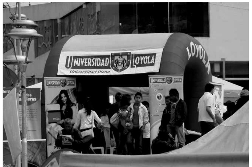
Stand Universidad Loyola

Además, estuvieron presentes varios colegios de la ciudad, que también mostraron el trabajo de investigación desarrollado dentro de sus establecimientos, participando en esta ocasión en un concurso de Ciencia y Tecnología, como parte de la cultura emprendedora promovida por la Alcaldía. Pese a las inclemencias del tiempo y la fuerte lluvia que azotó durante la mañana, los participantes estuvieron alegres de poder compartir los trabajos realizados en sus centros de estudio.