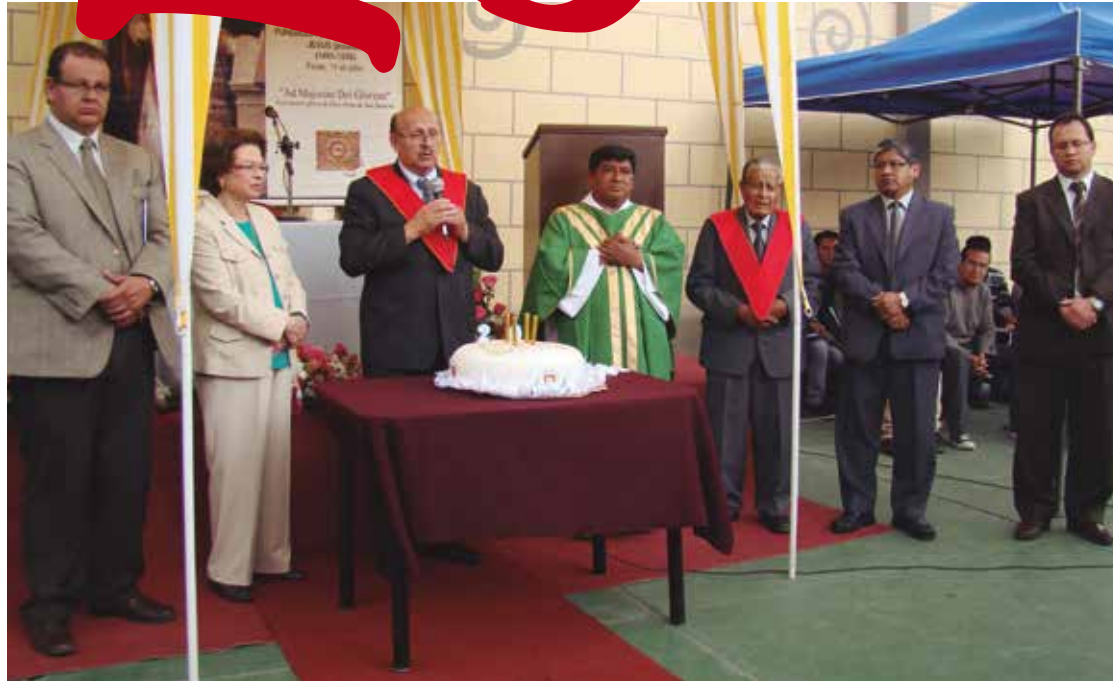
Fundación Loyola en los 20 años