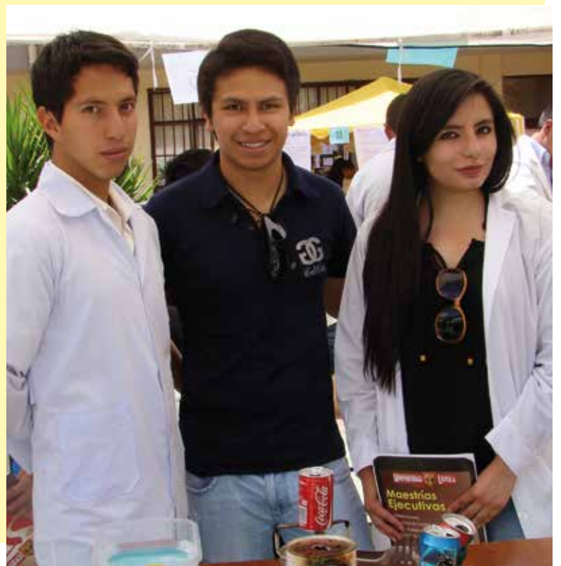
Estudiantes de Ing. Comercial