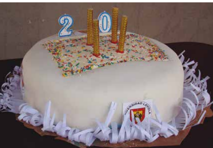
Celebración de los 20 años

La Fundación Loyola también hizo entrega de libros que irán para el apoyo bibliográfico de las carreras y estarán a disposición de todos los estudiantes en la Biblioteca Central de nuestra universidad, la cual tiene sus puertas abiertas todos los días de 9 am a 4 pm.