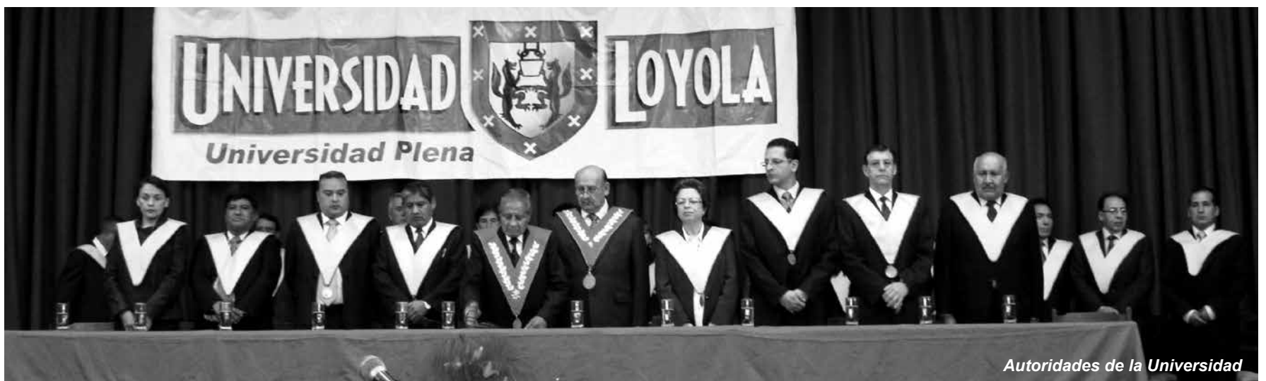
Autoridades de la Universidad