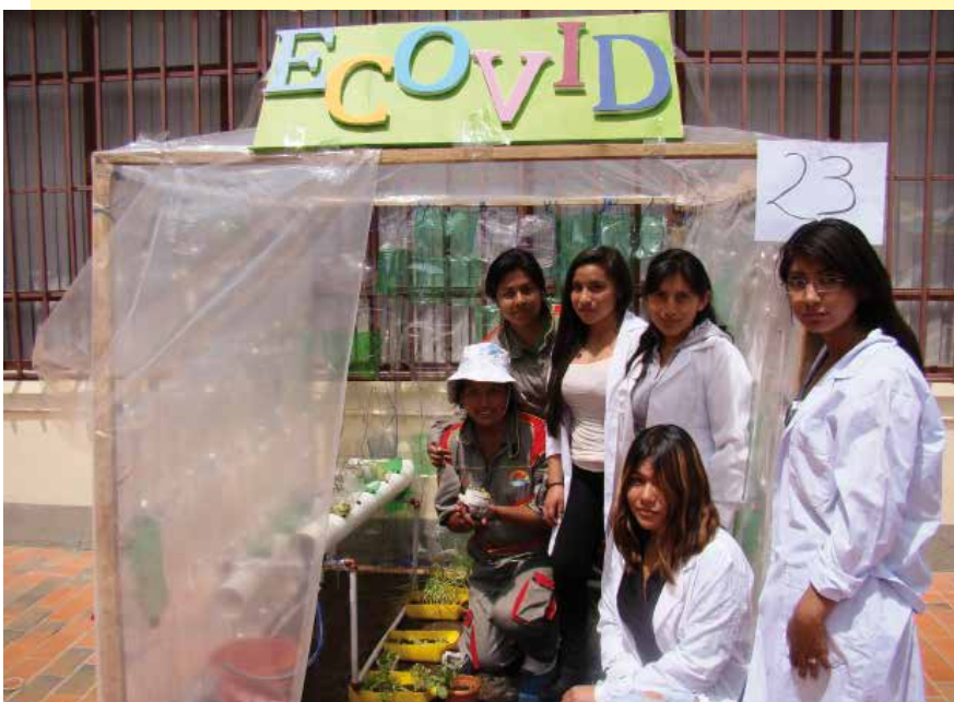
Estudiantes de Ing. Ambiental