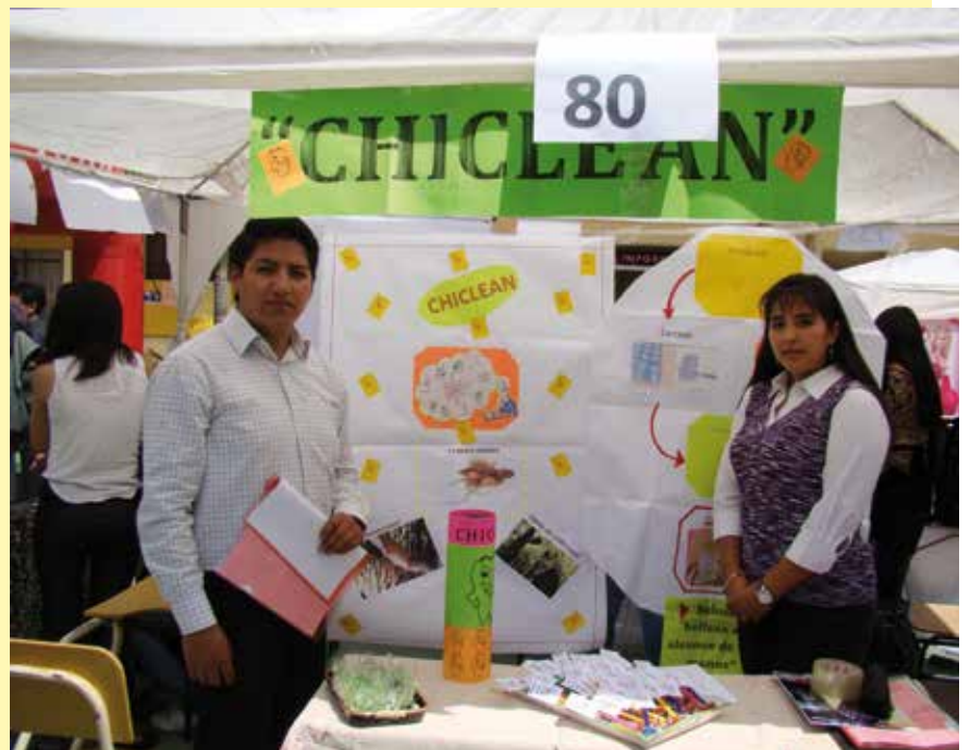
Estudiantes de Ing. Comercial