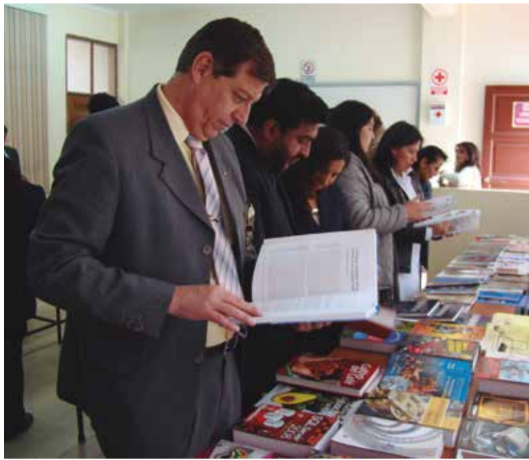
Entrega de libros