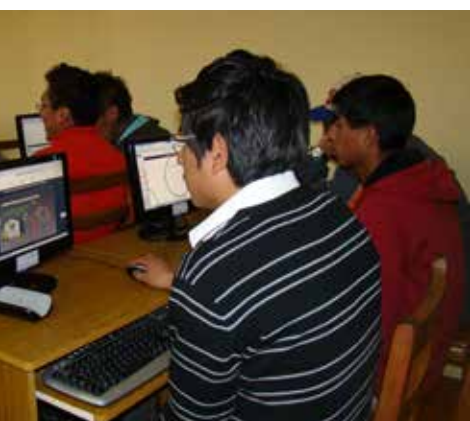
• Laboratorio de computación