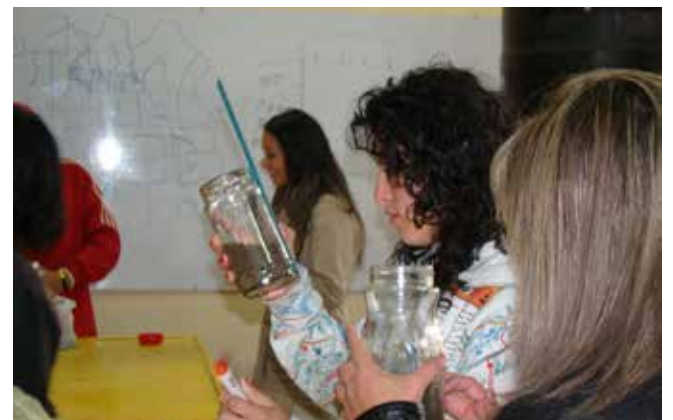
• Laboratorio de resistencia de materiales