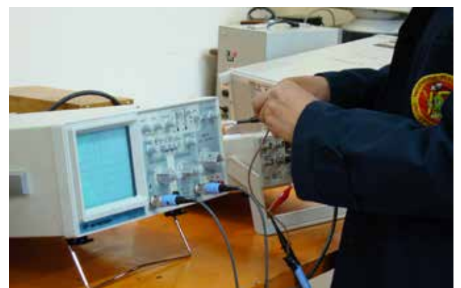
• Laboratorio de electrónica