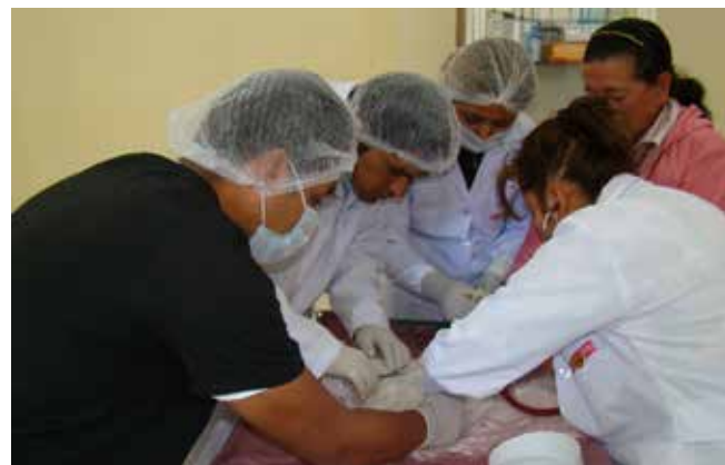
• Quirófano clínica veterinaria