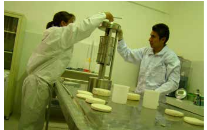
• Centro de innovación en lácteos