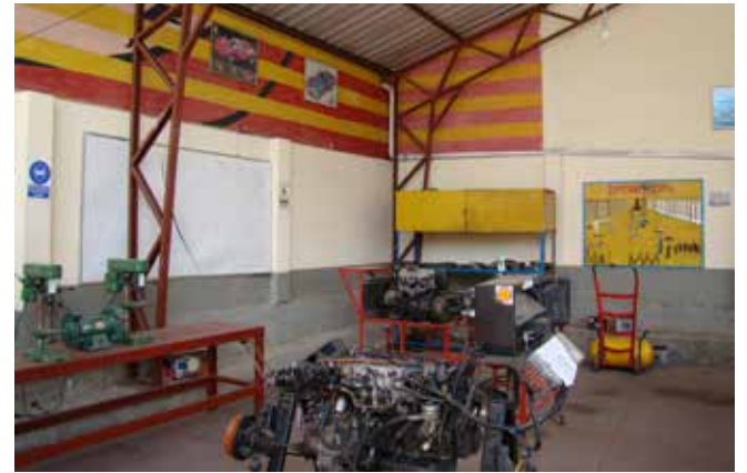
• Taller Automotriz