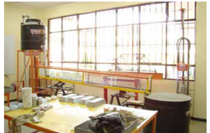
• Laboratorio de mecánica de suelos