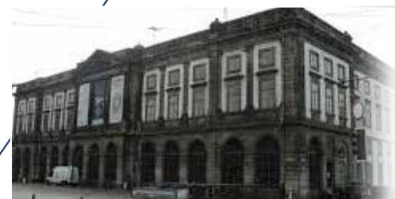
Universidad de Porto, Portugal