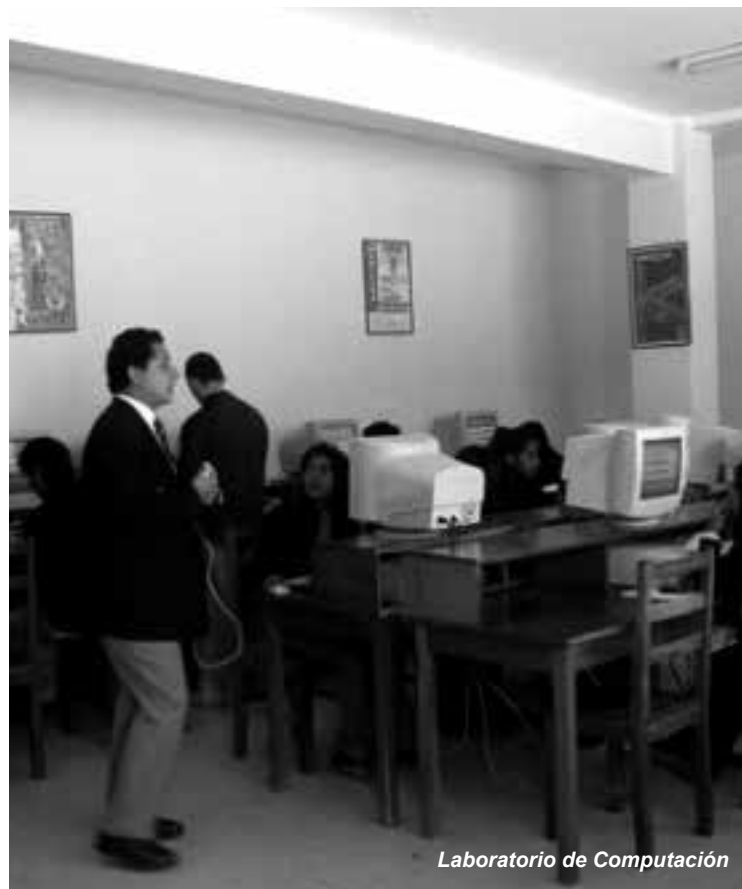
Laboratorio de Computación

No está por demás señalar que, durante las gestiones transcurridas, nuestra Superior Casa de Estudios tuvo muchos logros importantes, lo cual se traduce en un continuo crecimiento de su prestigio, valorado por propios y extraños, en el concierto nacional e internacional. Centenares de páginas no bastarían para reflejar la serie de aciertos, emprendimientos, visión futurista y el profundo compromiso, con nuestra sociedad y el país, de la Universidad Loyola, que marcha al influjo de la espiritualidad y filosofía ignacianas.