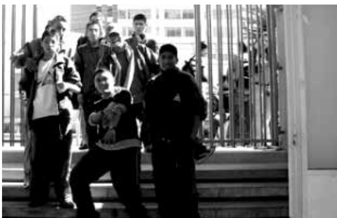
Universidad Loyola Sede Bajo Següencoma

Estudiantes de la Carrera de Mecánica presentando sus trabajos durante la Feria de Ciencia y Tecnología de la Universidad Loyola.