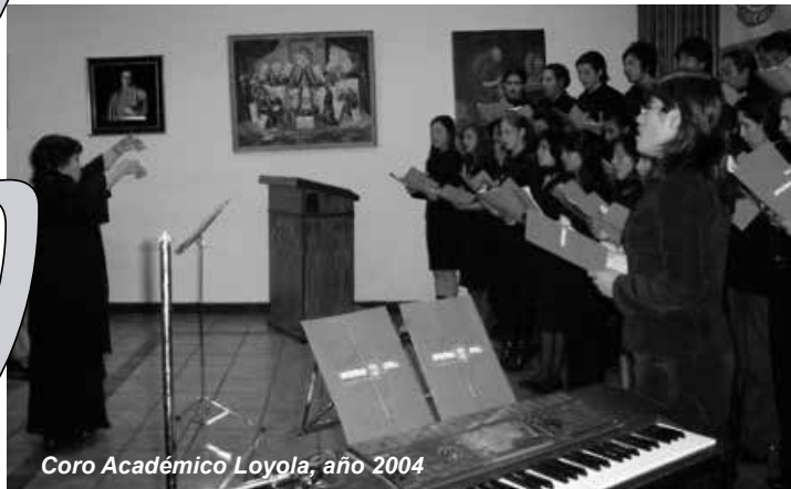
Coro Académico Loyola, año 2004

La Carrera de Música logra formar con sus alumnos la Orquesta de Cámara Loyola y el Coro Universitario Loyola, que dan inicio a sus actividades artísticas con brillantes conciertos, realizados en septiembre, el primero, y octubre, el segundo. Así, se plasma la incursión de la Universidad Loyola en el campo artístico de nuestra ciudad, obteniéndose elogiosos comentarios periodísticos dado el alto nivel demostrado por los conjuntos colegiados.