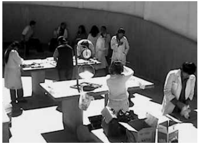
Anfiteatro de Veterinaria Sede Bajo Següencoma

A partir de fecha 21 de septiembre de 1998, mediante Resolución Ministerial No 307/98, se autoriza la apertura y funcionamiento legal de las carreras de Ingeniería Agronómica y Veterinaria y Zootecnia, a nivel Licenciatura. Se amplía entonces el aspecto de formación de profesionales en otras ramas, lo que obliga a que el año siguiente, 1999, se adquiera la gran infraestructura del Colegio Alexander Von Humboldt, predios que se encuentran en la zona de Bajo Següencoma, con una superficie de terreno aproximada de 3,800 mts 2 , la distribución de 32 aulas con capacidad para 40 alumnos cada una, un salón audiovisual y biblioteca, cada uno para 30 personas, además de laboratorios de física, química, biología, mecánica y centro de computación con 24 equipos de alta tecnología.