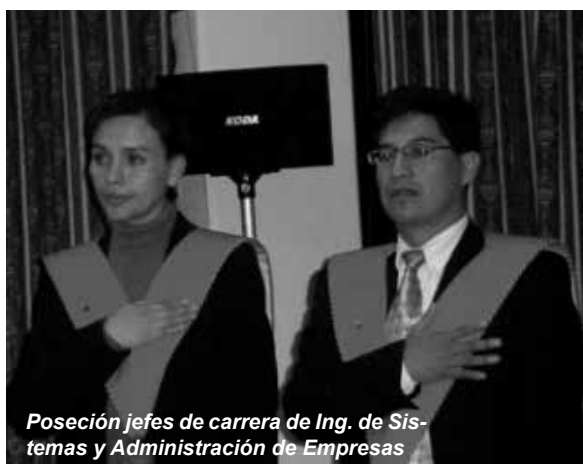
Poseción jefes de carrera de Ing. de Sistemas y Administración de Empresas

En el transcurso de su vida institucional, la Universidad Loyola y sus Jefaturas de Carrera siempre han contado con docentes de amplia trayectoria, tanto dentro del campo del ejercicio profesional como en la cátedra universitaria. La selección de docentes ha sido rigurosa, procurando siempre que quienes accedan a la docencia sean elementos con excelente formación académica y personal, puesto que esto se reflejará en el posterior desempeño de los estudiantes que se forman en sus aulas.