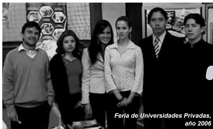
Feria de Universidades Privadas, año 2006