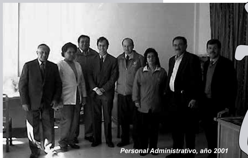
Personal Administrativo, año 2001

Director de Planificación y Autoevaluación