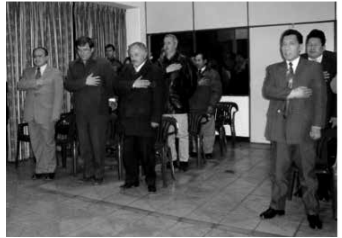
Auditorio Central Sede Edif "El Sauce" Miraflores

Con Resolución Ministerial No 149/98, se inicia la enseñanza de siete nuevas carreras: Ingeniería Industrial, Mecánica, de Medio Ambiente y Recursos Naturales, Económica, Financiera, Agrícola, e Ingeniería en Topografía y Geodesia, también a nivel Licenciatura.