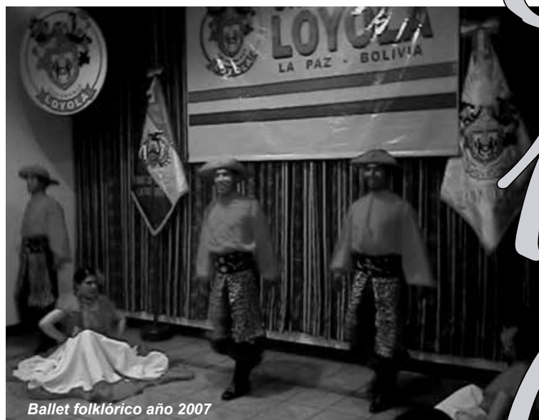
Ballet folklórico año 2007

Es necesario mencionar que, en el transcurso de todos estos años, la Universidad Loyola, con el concurso de sus alumnos graduados, ha contribuido en el mejoramiento caminero, agro industrial y electrificación de las comunidades de Cantuyo, Collantaca, Caruyo y Poque, adyacentes a la población de Laja, a través de la elaboración de Tesis de Grado, con proyectos de implementación a corto plazo y de prácticas de campo, como parte de su formación humanística. En el mes de diciembre de 1999 se gradúa la primera promoción. 16 nuevos profesionales reciben sus títulos académicos de manos de las autoridades de nuestra Universidad, dando inicio a una nueva pléyade de profesionales.