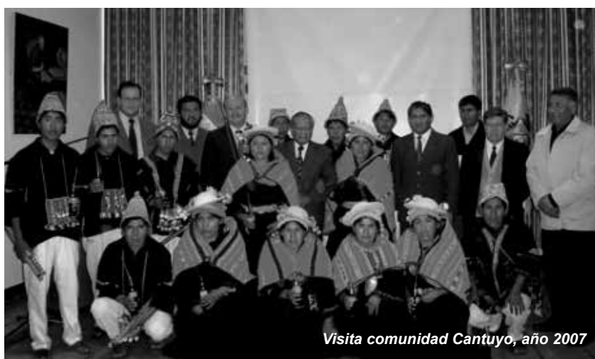
Visita comunidad Cantuyo, año 2007