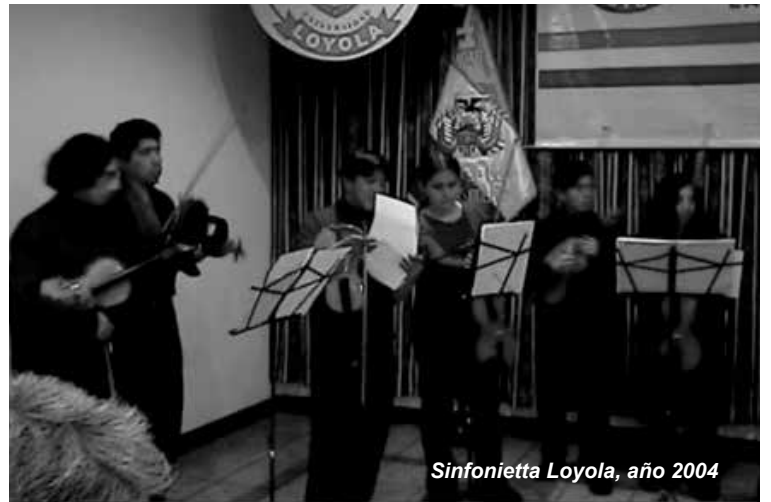
Sinfonietta Loyola, año 2004

Contando con una apropiada infraestructura, que da paso a la comodidad absoluta para docentes y alumnos, así como la implementación de nuevas carreras, con Resolución Ministerial No 023/00 de 12 de enero de 2000, se autoriza la apertura y funcionamiento de las carreras de Comunicación Social, Música, Derecho y Auditoría. Fruto de ello es la puesta en vigencia, para la Carrera de Comunicación Social, de una sala especial de grabación, mientras que, a la vez, ésta ha publicado varios números del periódico oficial de la Universidad Loyola con el denominativo de "El Sauce", que reflejan el trabajo de los alumnos de la Carrera de Comunicación Social y de las actividades que se desarrollan en el seno de la Universidad.