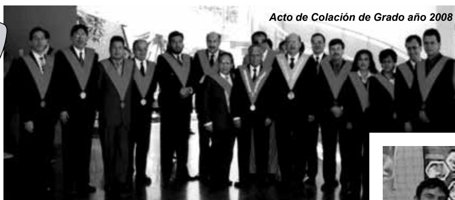
Acto de Colación de Grado año 2008